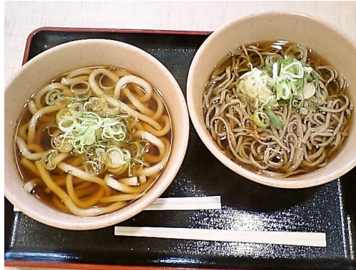
和麵(うどん・そば) 各種 400円