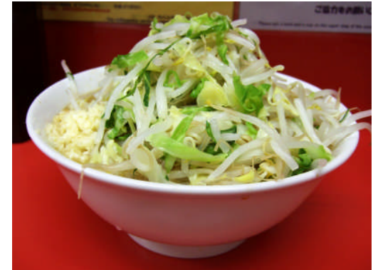
中華麵 各種 400円～