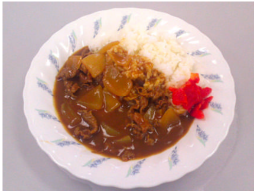
カレーライス 各種 400円～