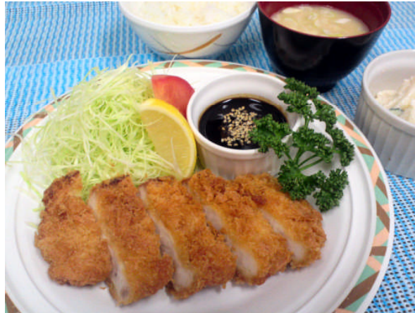
コースとんかつ定食 550円