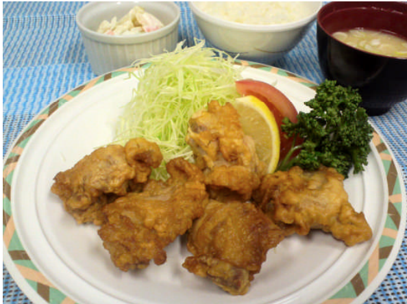
鳥の唐揚げ定食 550円